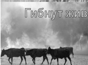
Гибнут животные и птицы

Несанкционированные поджоги сухой травы ОПАСНЫ!